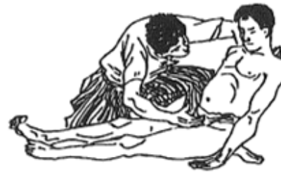
圖 3 襟 活 Fig. 3 Eri - katsu