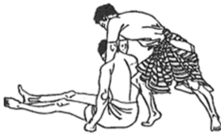
圖 2 誘 活 Fig. 2 Sasoi - katsu