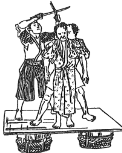
图 9 縊死者仰卸法 Fig. 9 Ishisa - gyosha - ho

Ishisa Gyosha Ho Kappo metodo di rianimazione per persona impiccata a cui successivamente veniva