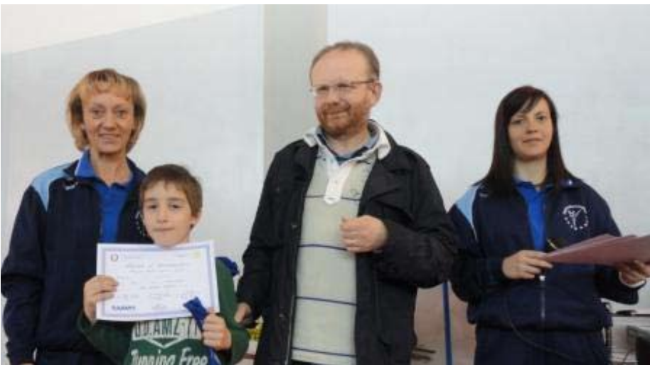
Il Preside della Scuola M. Giardini di Penne