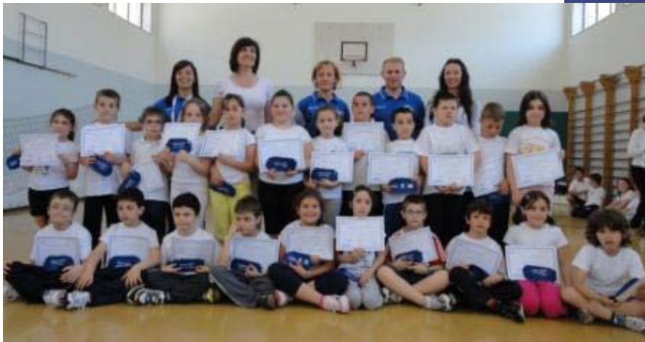
La Classe Seconda della Scuola S. Panfilo di Penne

I Dirigenti Scolastici e i Docenti, in occasione dei saggi hanno sottolineato l'importanza del Progetto Sport a Scuola Karate, ribadendo che è un efficace mezzo educativo basato sulla condivisione degli obiettivi posti dai Program-