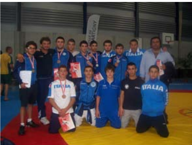
La squadra al completo