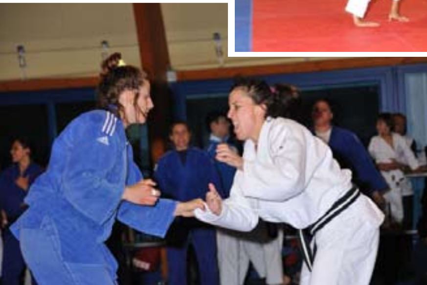
Scanu - Carofiglio