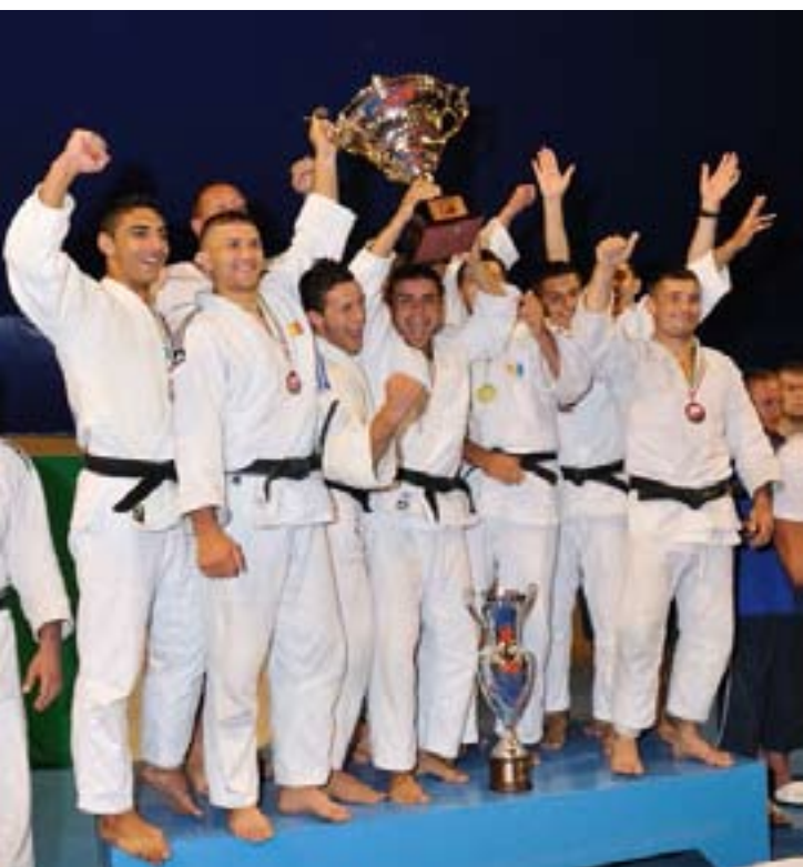
Romania 1° classificata