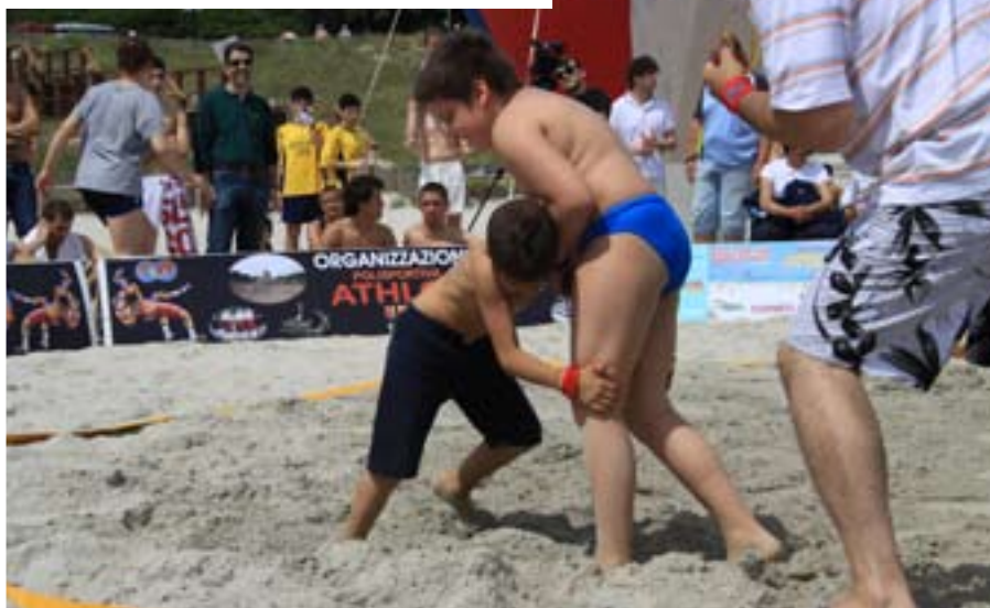
la formica all'attacco del gigante