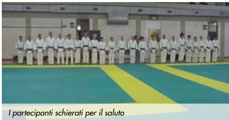
I partecipanti schierati per il saluto