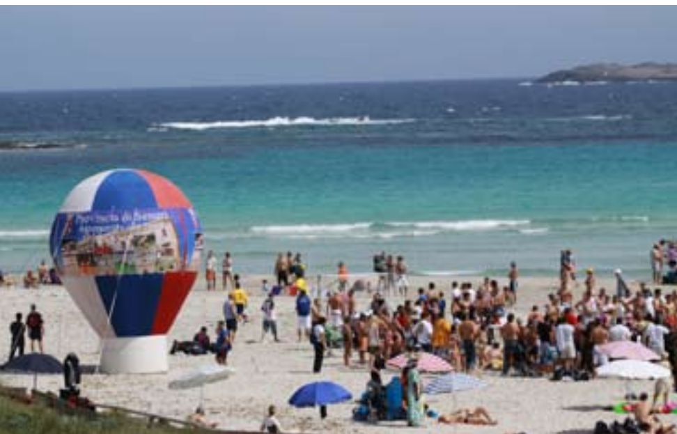
L'area di gara nella meravigliosa spiaggia La Pelosa di Stintino