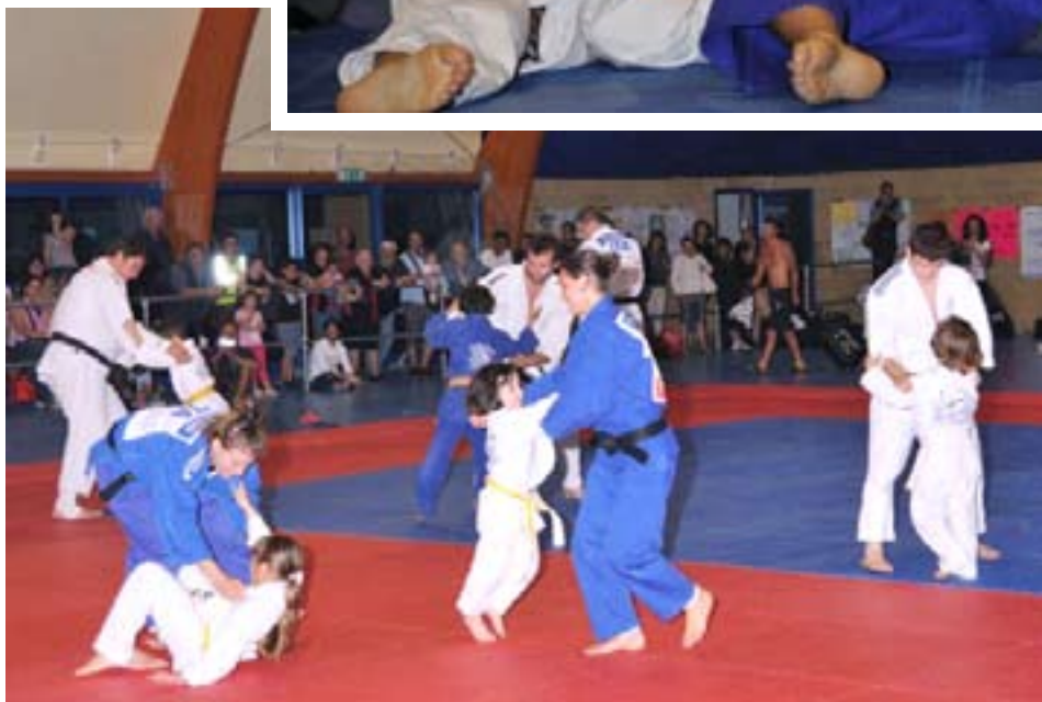
Bambini e Campioni insieme sul tatami