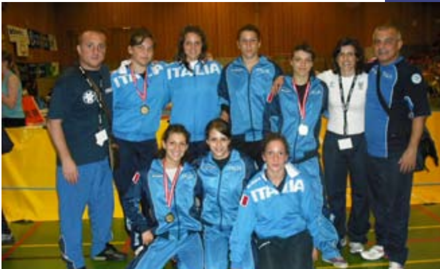
La squadra con gli allenatori