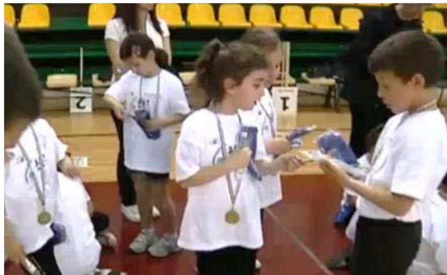
La premiazione del Saggio di Alanno-Rosciano