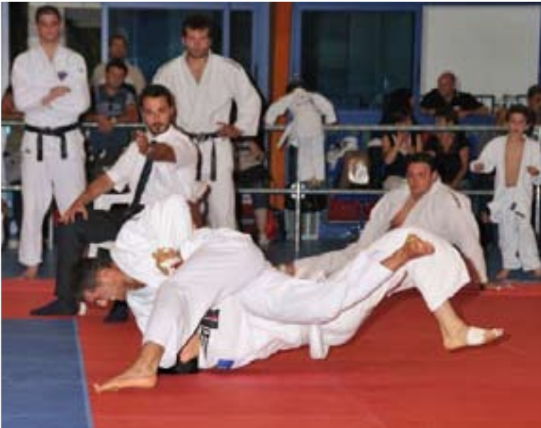
Eliminatorie Uzbekistan Italia