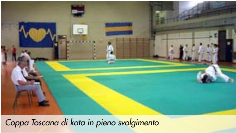
Coppa Toscana di kata in pieno svolgimento