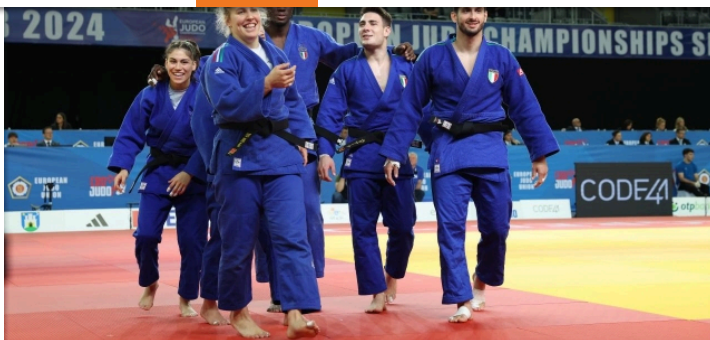
La squadra azzurra, quinta classificata agli Europei di Zagabria

IL TEAM EVENT – A proposito di piazzamenti importanti, il quinto posto ottenuto ieri dalla squadra mista azzurra ha portato a una scalata del ranking per la partecipazione al Team Event a Parigi: il 21esimo posto, anche se non offre benefici da testa di serie, ha un elevato coefficiente di consistenza, in quanto maturato con le due sole partecipazioni agli Europei 2023 e 2024.