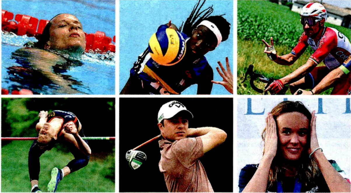
Da sinistra in alto: Federica Pellegrini, Paola Egonu, Elia Viviani, Elena Vallortigara, Guido Migliozzi, Margherita Panziera