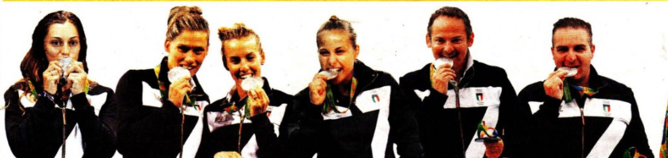
ARGENTO 6 agosto SCHERMA - Spada individuale ROSSELLA FIAMINGO