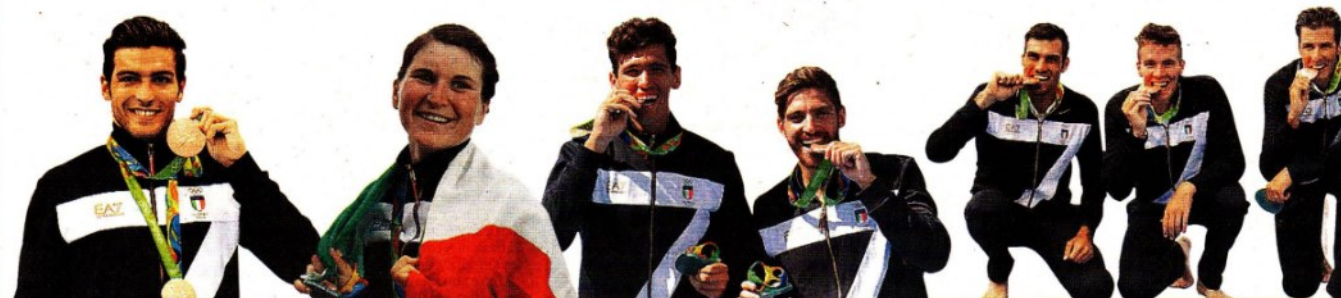
BRONZI 6 e 13 agosto NUOTO - 400 sl e 1500 sl GABRIELE DETTI