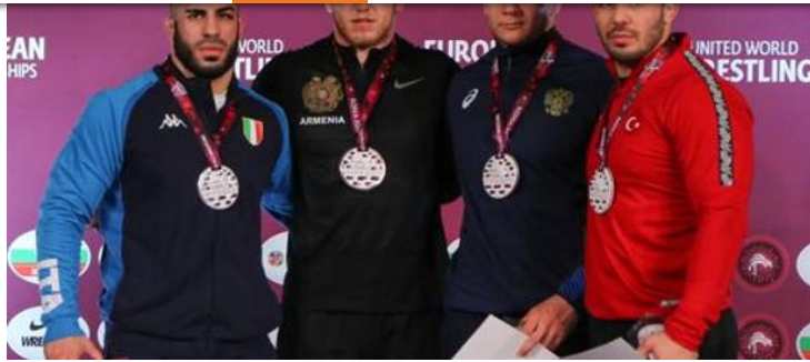
Il podio dei -97 kg. Di Felicianonio