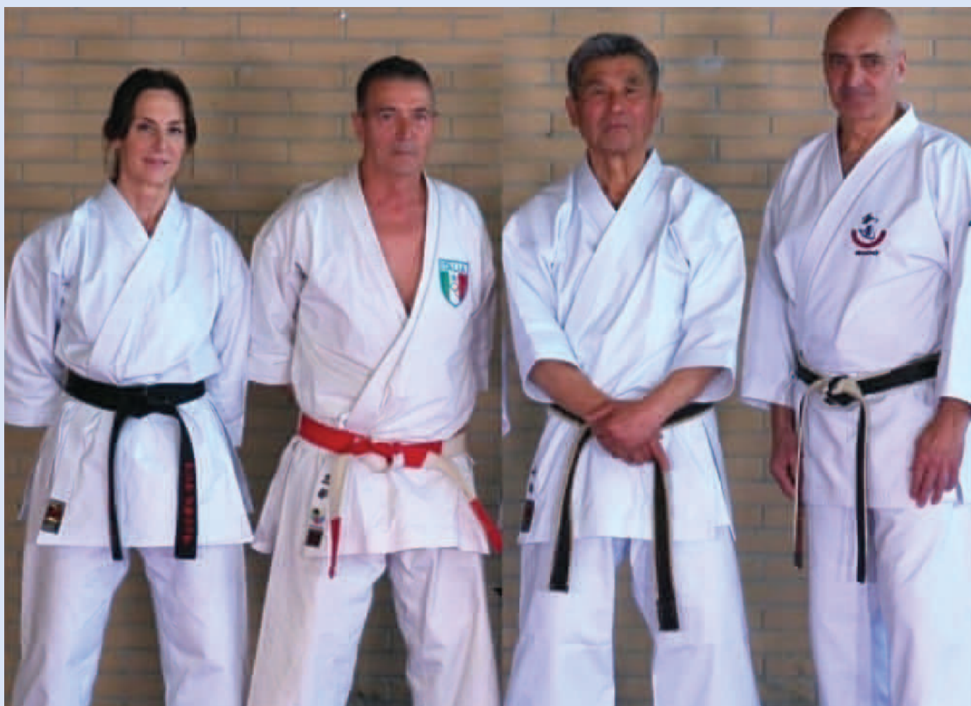
A. BALDELLI GOJU RYU