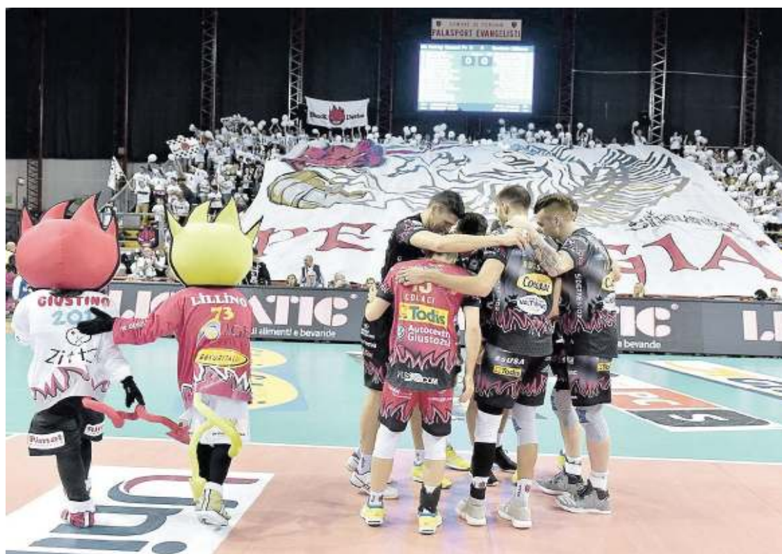
La Sir Safety Conad Perugia a caccia della quinta vittoria consecutiva oggi con Monza

COACH BERNARDI CONFERMA IL SESTETTO TIPO SUGLI SPALTI ATTESI OLTRE 2500 TIFOSI